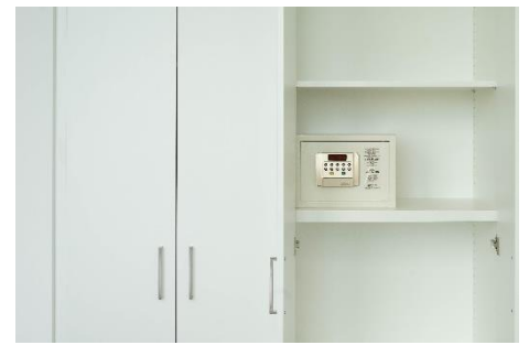
Schrank mit Safe